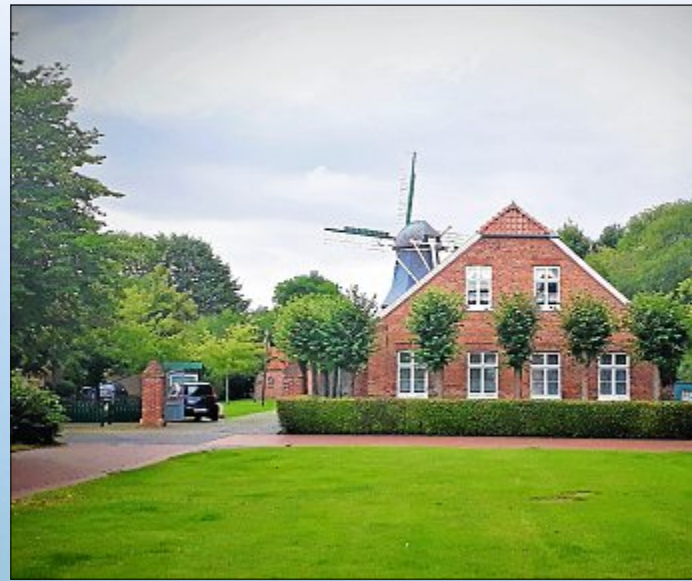
Müllerhaus und Mühle in Leezdorf sind ein zentraler Punkt für viele Veranstaltungen.

und Vereine im Blick hat. Am 26. September möchte sie einen Arbeitskreis ins Leben rufen, möglichst mit Vertretern aus allen Gemeinden, der Ideen sammelt